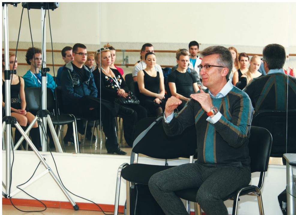
Сядем рядком да потолкуем ладком