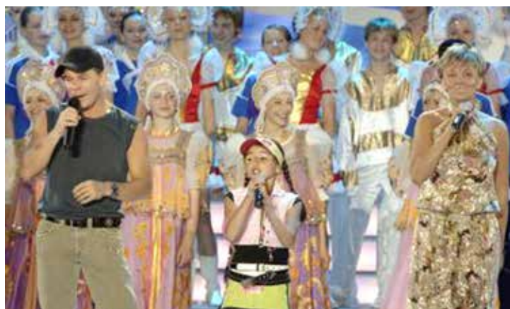
Заключительный тур II фестиваля «Факел» в Геленджике. 2007 год