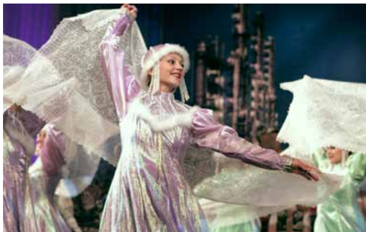
Первый зональный тур в Оренбурге. 2004 год

творческие делегации встречались на площадках Геленджика (4 раза), Сочи (3 раза). Оренбург в 2022 году стал местом концентрации талантов, работающих в нефтегазовом секторе, в третий раз. Почетными гостями «Факела» в разные годы были представители региональных властей, ПАО «Газпром» и его зарубежных компаний-партнеров из Франции, Словении, Германии, Австрии, Вьетнама и Боливии.