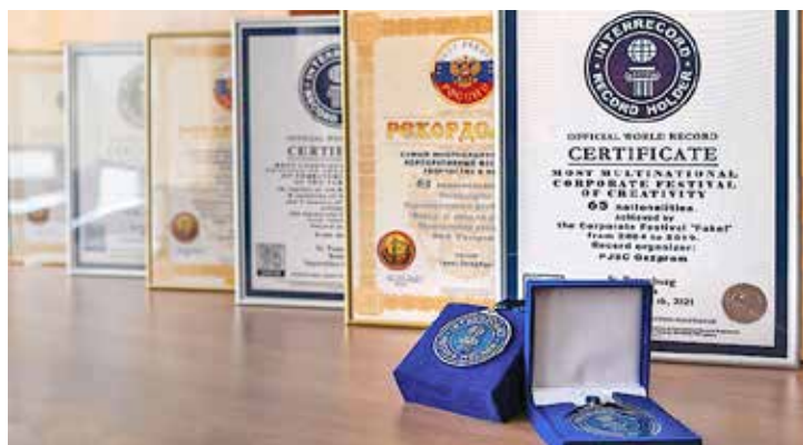
В 2021 году Международное агентство «Интеррекорд» признало фестиваль «Факел» рекордсменом по количеству участников