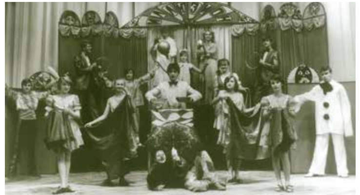
Вот уже почти четыре десятка лет во Дворце «Газовик» поддерживают и развивают культурные традиции

В 2007 году в рамках подготовки к празднованию 40-летия Общества «Газпром добыча Оренбург» по программе «Газпром — детям» провело масштабную реконструкцию и модернизацию Дворца. Она