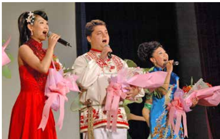
Фестиваль искусств ОАО «Газпром» и КННК в Пекине, Китай. 2010 год