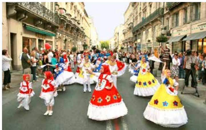
Международный детский форум «Этот мир — наш!» в Авиньоне, Франция. 2010 год

За 18-летнюю историю фестиваля его участников принимали 22 города России, Беларуси, Китая и Франции. Чаше всего