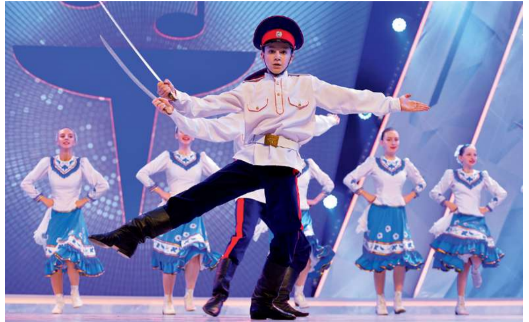
Ансамбль «Донской родничок»

и силу. Смысл игры состоит в том, что джигит на скаку должен забрать платок у девушки и вручить его обратно. Подарком становится поцелуй. Сложность в том, что каждый хочет быть тем самым счастливым, но победителем становится только самый быстрый и ловкий!