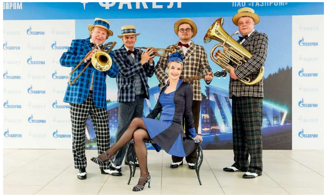
Ансамбль «Крутой ландыш»

«Я мечтала быть актрисой мюзикла, – признается солистка «Крутого ландыша». – И вот мечта сбывается: я работаю в этом коллективе, участвую в корпоративном фестивале «Факел», пою, танцую и играю на сцене».