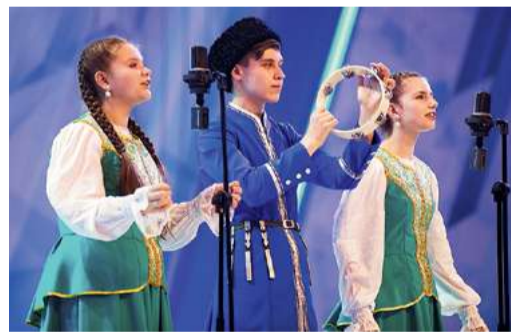
Ансамбль народной песни «Родничок»

Образцовый хореографический ансамбль «Далан» из «Газпром трансгаз Уфа» привез на фестиваль танец «Таштугай уйындары». Сюжет номера таков: рядом с деревней на поляне собираются молодые люди. Девушки надевают национальные украшения, башкирские джигиты облачаются в еланы и сарыки. Мужчины садлают горячих скакунов, проявляют свою ловкость