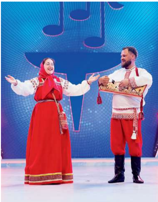
Дуэт «СмоРОДИНА», «Газпром трансгаз Санкт-Петербург»

В ОБЩЕЙ СЛОЖНОСТИ 258 НОМЕРОВ ОТСМОТРЕЛО ЖЮРИ НА ЗОНАЛЬНЫХ ТУРАХ «ФАКЕЛА». ЛУЧШИЕ ИЗ ИСПОЛНИТЕЛЕЙ ОКАЗАЛИСЬ В СОЧИ, ЧТОБЫ ПОБОРОТЬСЯ ЗА ЗВАНИЕ ПОБЕДИТЕЛЕЙ.