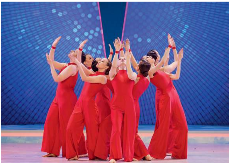
Коллектив «Лапушки», «Газпром трансгаз Югорск»