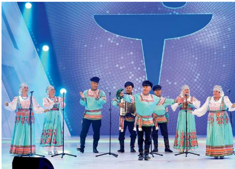
Коллектив «Северяне», «Газпром трансгаз Самара»

Дарья МАЙОРОВА