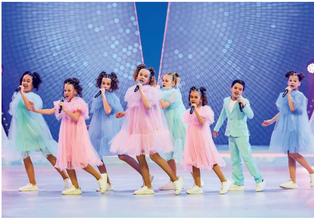
Коллектив «Барби коктейль», «Газпром трансгаз Казань»