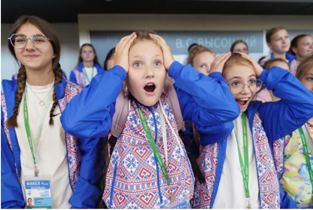
«Мама, ты не поверишь! Мы на «Факеле!»