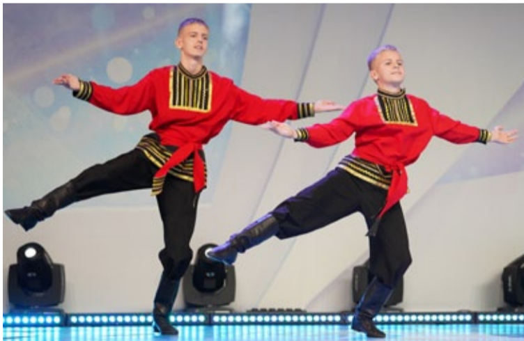
Коллектив «Завтрашний день», ООО «Газпром трансгаз Санкт-Петербург»