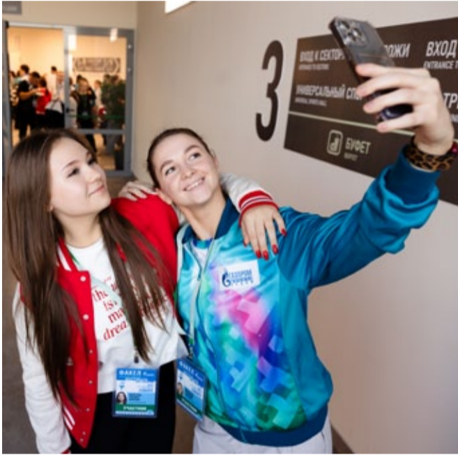
Фестиваль – место встречи друзей из разных делегаций