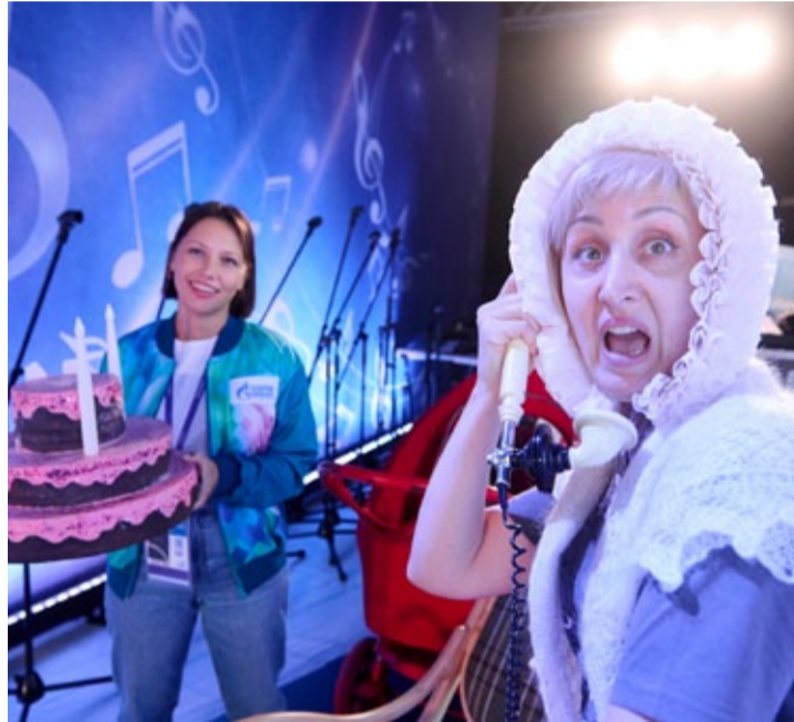
Артисты оригинального жанра и в кадре смотрятся оригинально