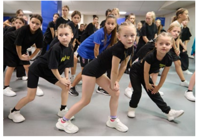
Наставникам внимают все от мала до велика