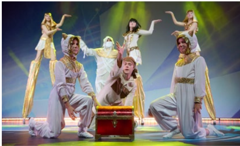
Театр «Иллюзион», ООО «Газпром добыча Оренбург»

Зональные туры юбилейного фестиваля проходят в Год семьи. И это символично, ведь любовь к творчеству и «Факелу» многие участники передают от поколения к поколению!