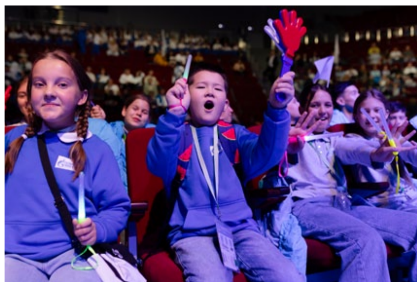
Эмоции похлеще, чем на стадионе!