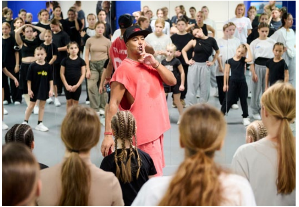
Мастер-класс требует тишины и сосредоточенности