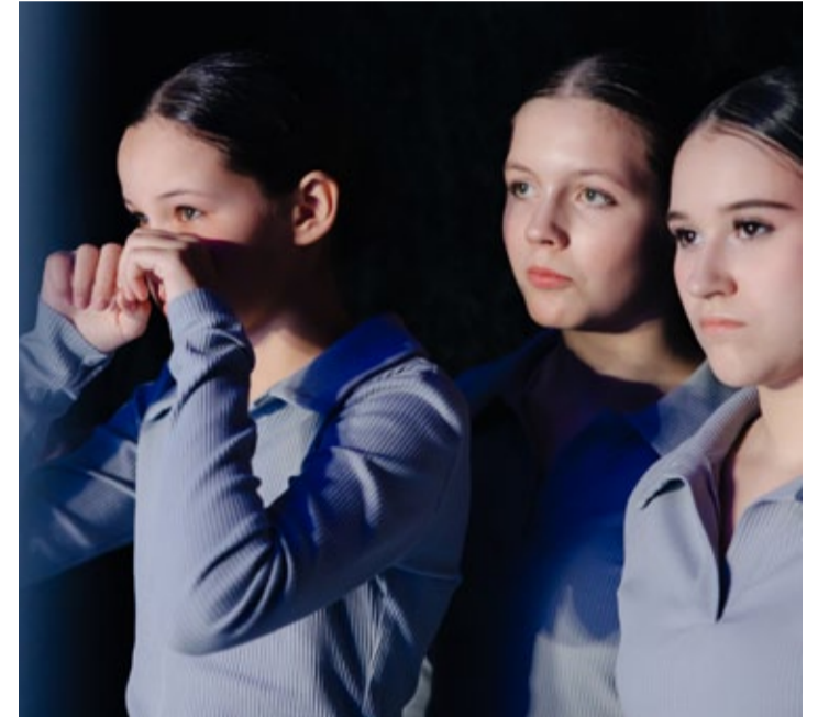
Каждый номер конкурсной программы пробирает до мурашек