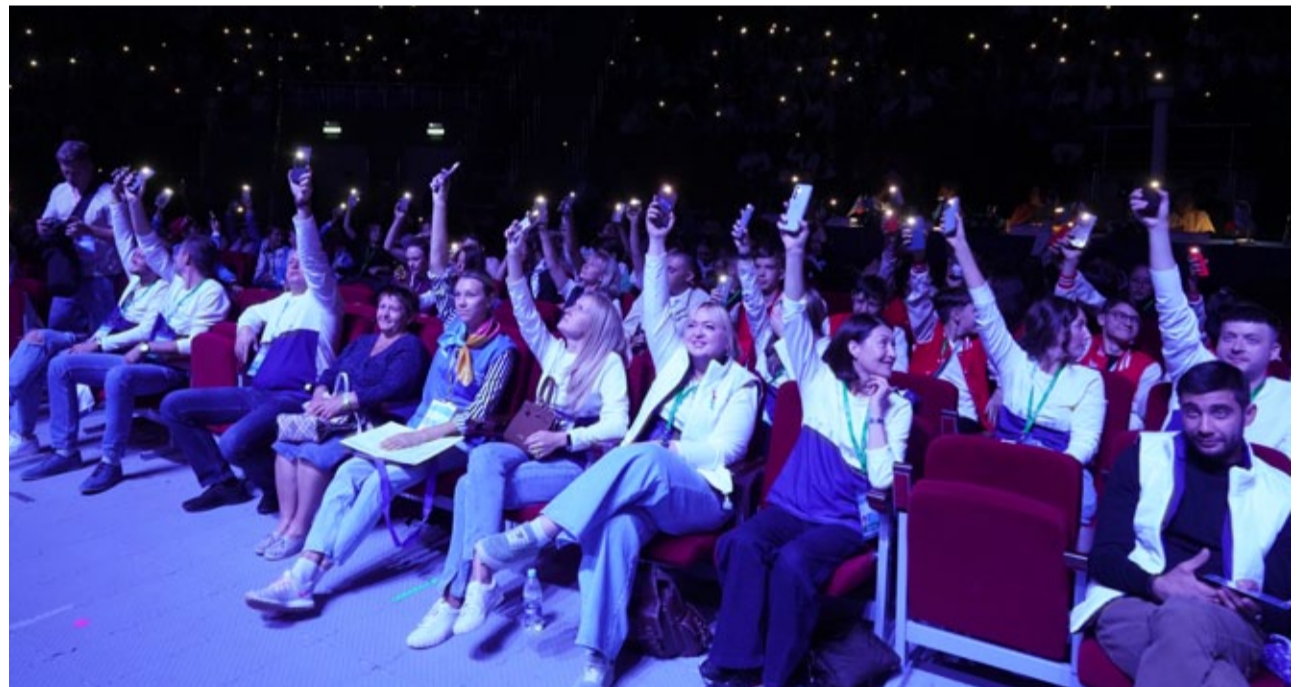
«Факел» - это свет