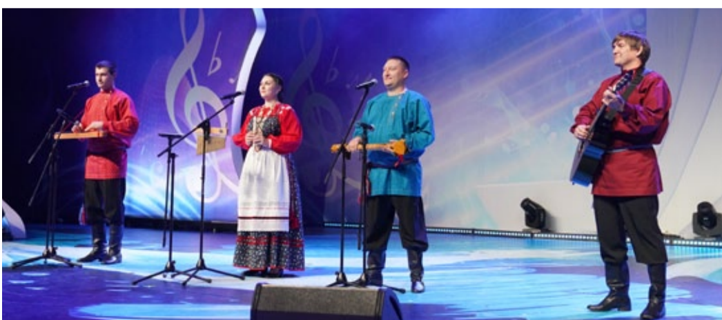
Ансамбль «Развернись душа», ООО «Газпром трансгаз Самара»

Николай ШИРОКОВ