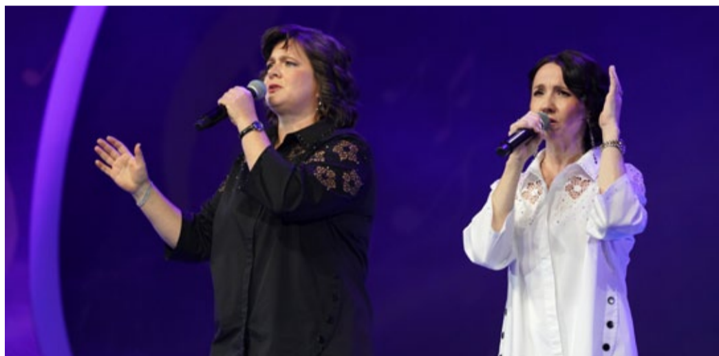
Дуэт «Роза ветров», ООО «Газпром трансгаз Ставрополь»