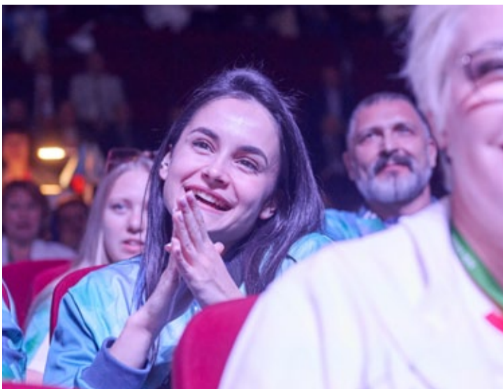
Факеллисты болеют за своих так же искренне, как и выступают сами