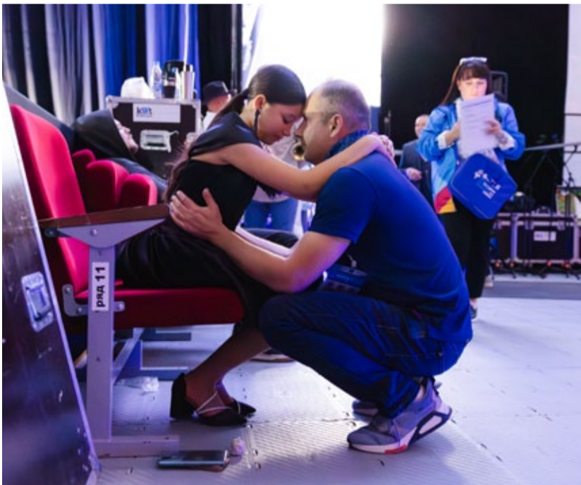
Главная опора артиста – поддержка близких