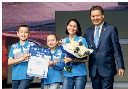
Детский фольклорный ансамбль «Шурампус» («Газпром трансгаз Нижний Новгород»)