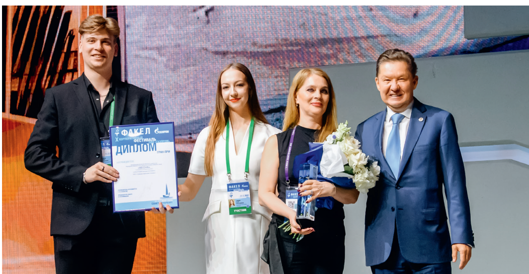
Алексей Миллер и заслуженный коллектив народного творчества Республики Башкортостан Народный ансамбль бального танца «Весна» («Газпром нефтехим Салават»)

В возрастной категории от 11 до 16 лет обладателем Гран-при стал детский фоль-