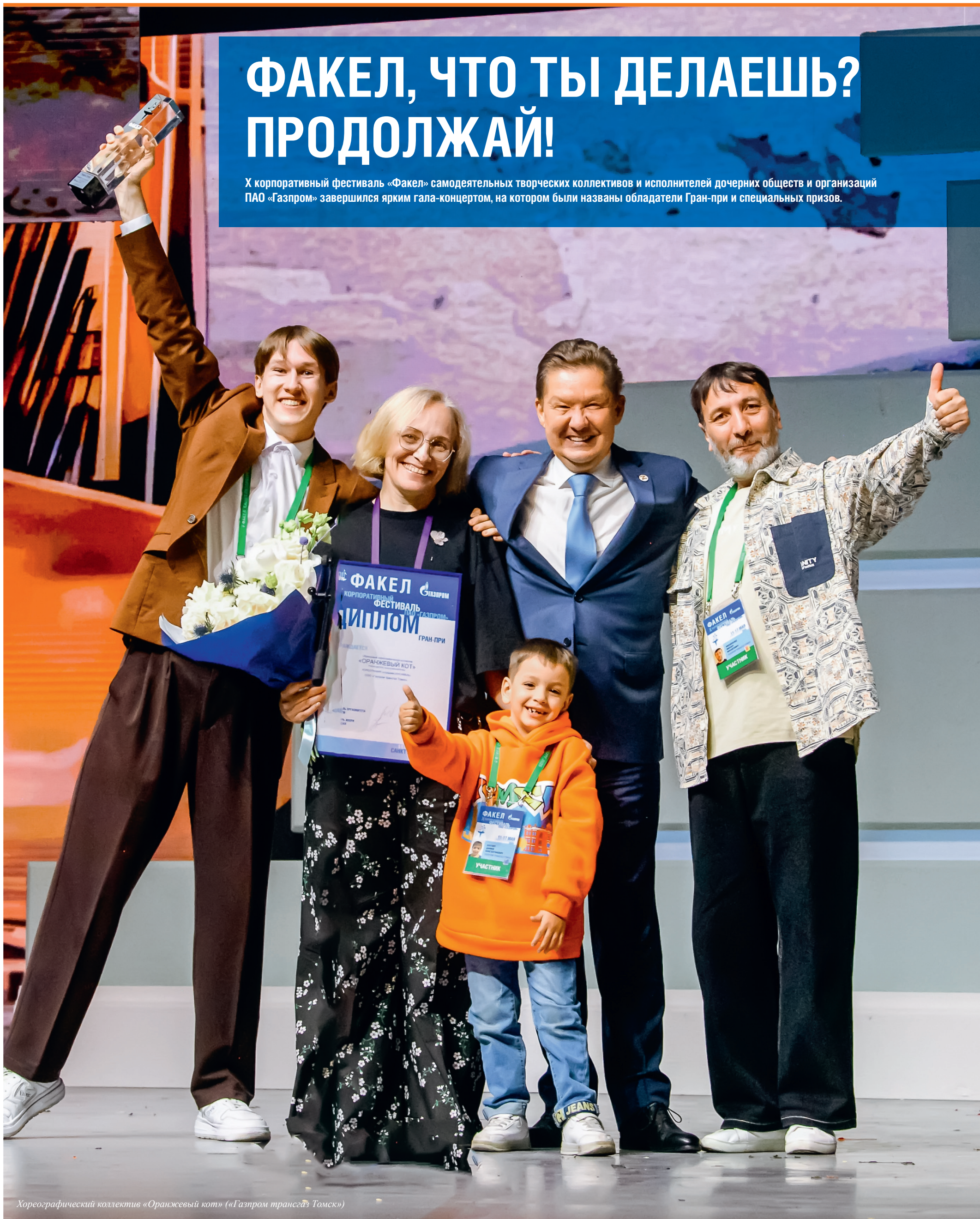
Хореографический коллектив «Оранжевый кот» («Газпром трансгаз Томск»)

X корпоративный фестиваль «Факел» самодеятельных творческих коллективов и исполнителей дочерних обществ и организаций ПАО «Газпром» завершился ярким гала-концертом, на котором были названы обладатели Гран-при и специальных призов.