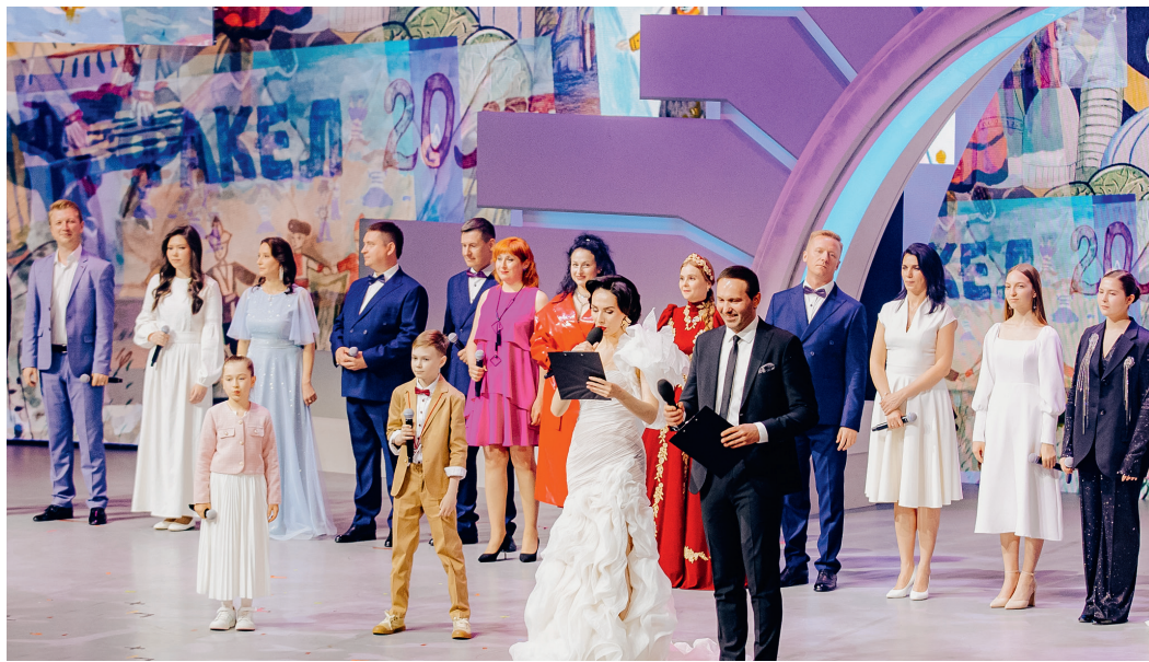
Финальная песня Гала-концерта