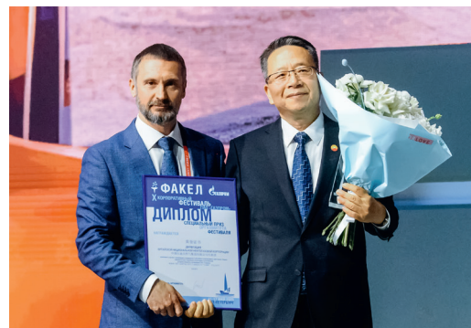
Специальный приз Оргкомитета был вручен делегации Китайской национальной нефтегазовой корпорации